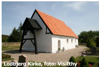
Lodbjerg Kirke, foto: Visitthy

www.danmarksnationalparker.dk/Thy www.udinaturen.dk (vandre- og cykelruter)