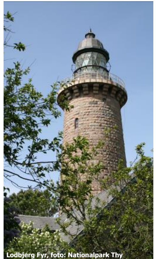
Lodbjerg Fyr