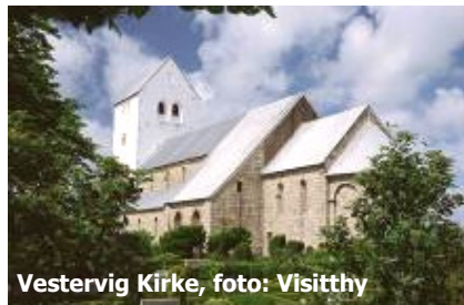
Vestervig Kirke